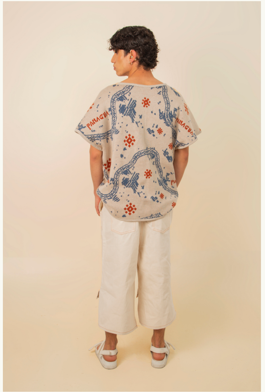
PONCHO PANAGUÁ - PANTALÓN / PANTS MACHE-MACHE