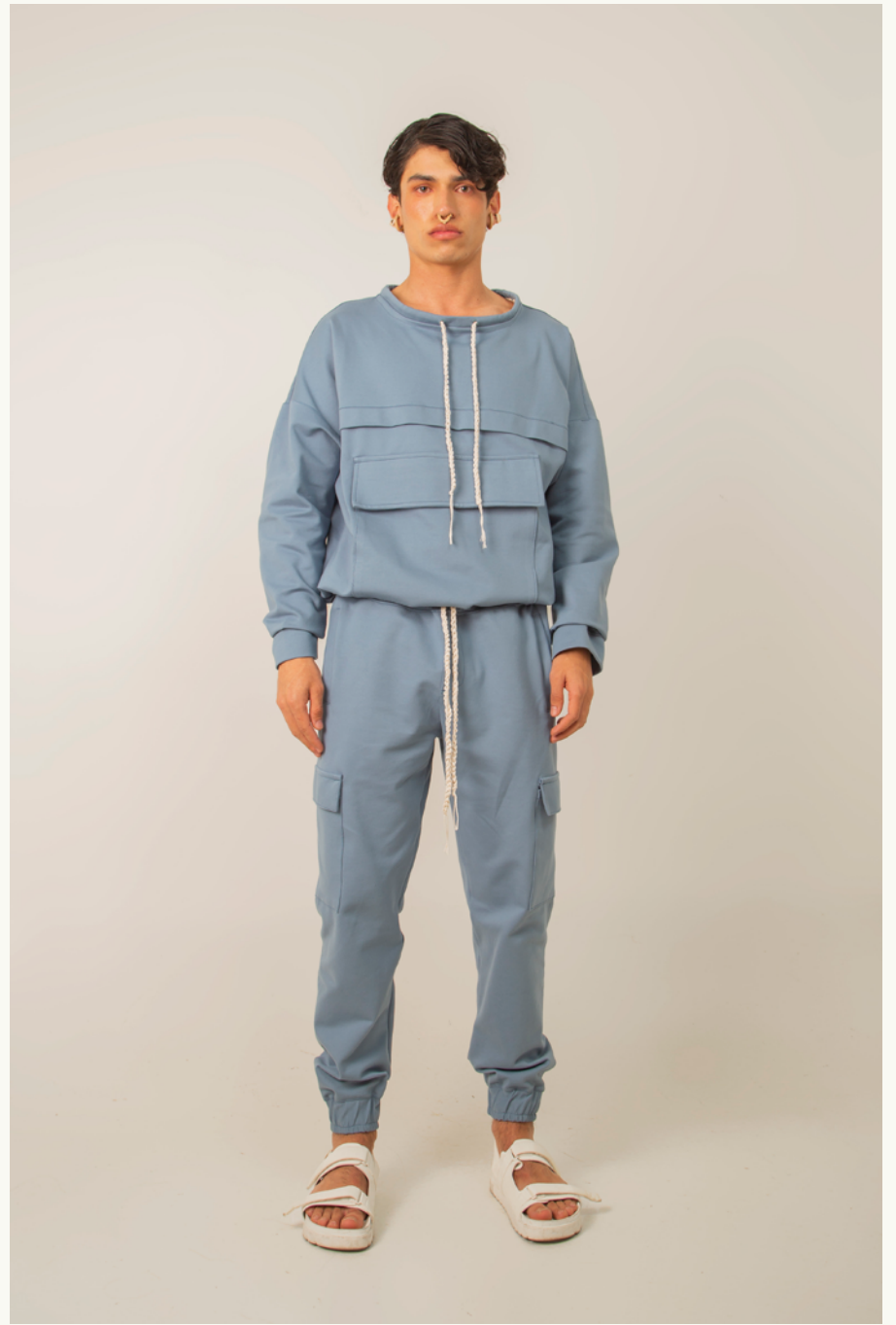
SUÉTER / SWEATER COLOSÓ - PANTALÓN/PANTS CARGO COLOSÓ