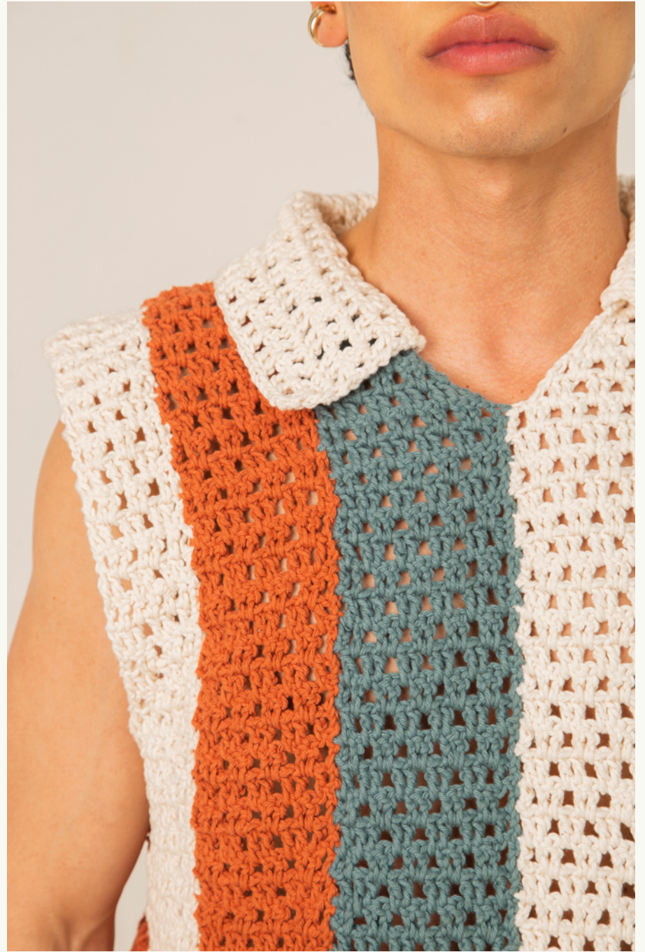
SUÉTER / SWEATER CHAMARRETA ECO - PANTALÓN / PANTS GUAMACÓ