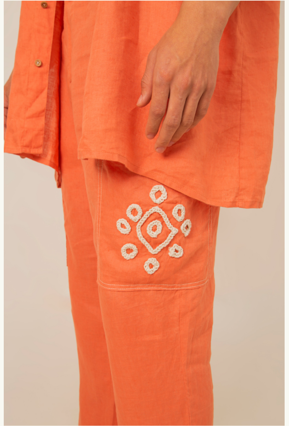
CAMISA / SHIRT COCORILLA - TOP HORQUETA ECO - PANTALÓN / PANTS COCORILLA