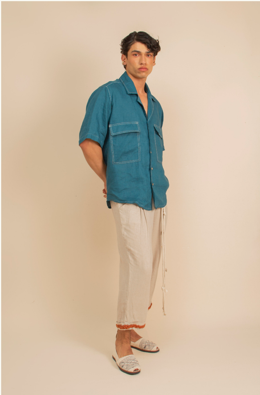
CAMISA / SHIRT CANALETE - PANTALÓN / PANTS PILÓN