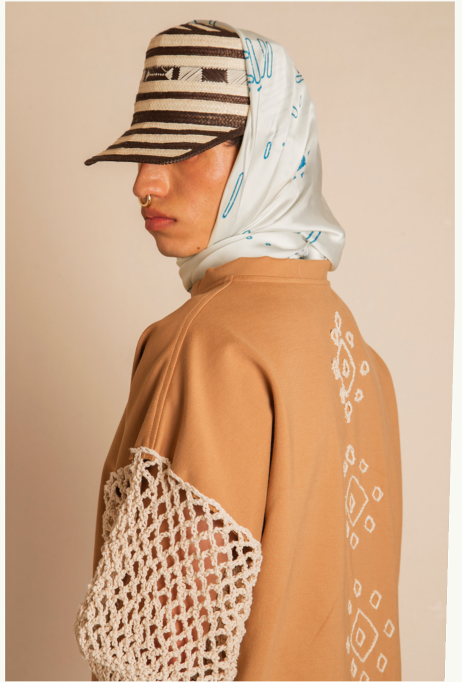
SUÉTER / SWEATER CANOA P. - PANTALÓN / PANTS CARGO CANOA P.