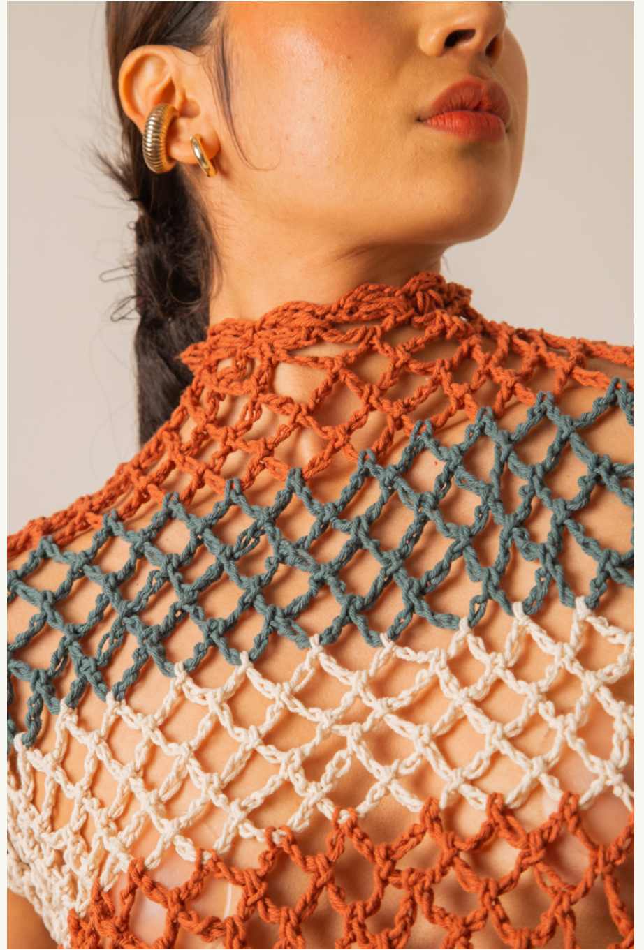
TOP AWAITE ECO - FALDA / SKIRT PANAGUÁ