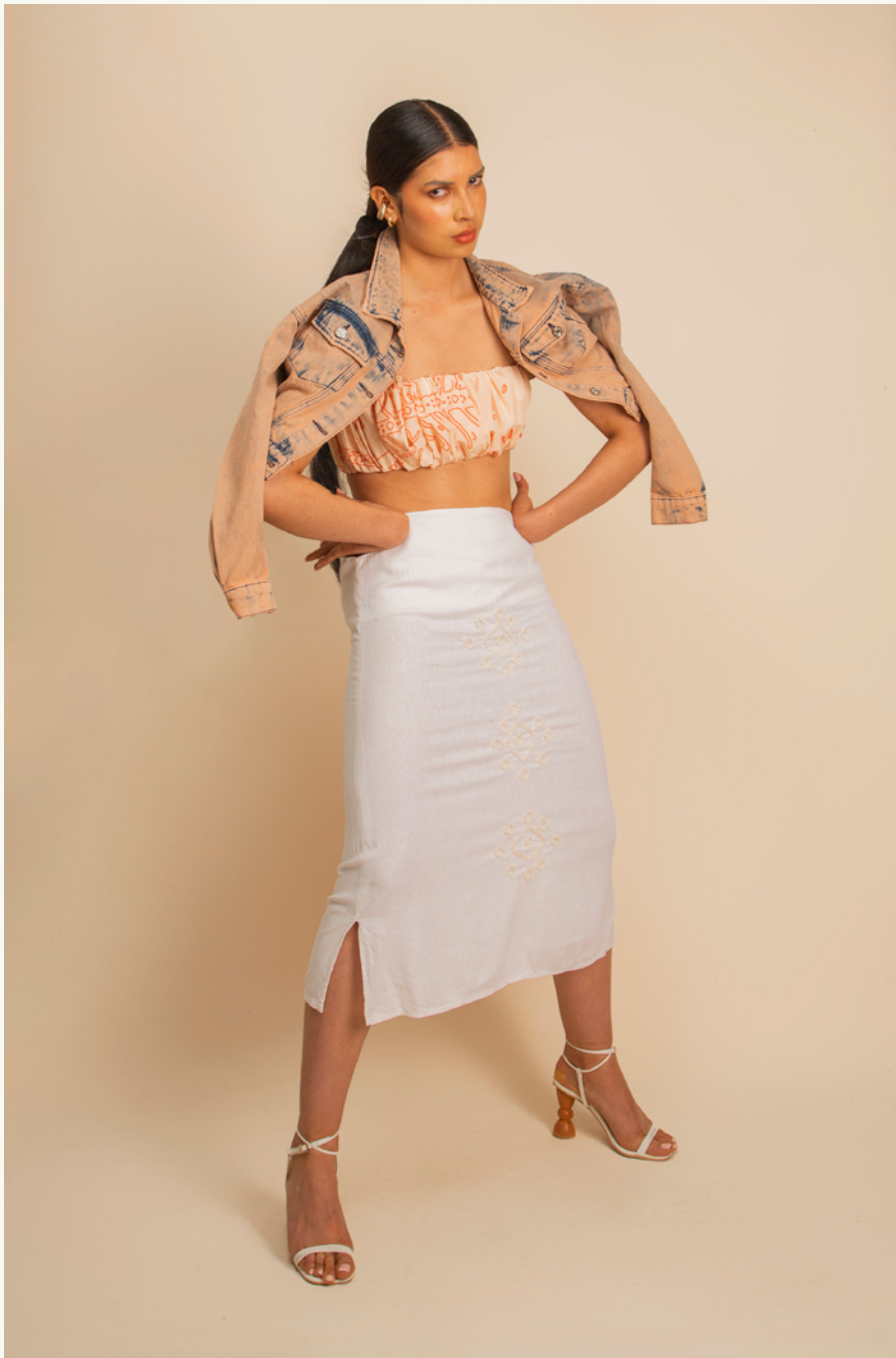
CHAQUETA CROP / CROP JACKET CENAGOSA TOP GRAN ZENÚ ECO - FALDA / SKIRT GRAN CACICA