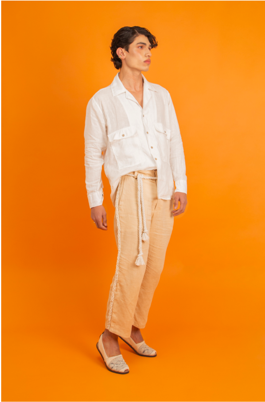
CAMISA / SHIRT CUENCA - PANTALÓN / PANTS SINUANO