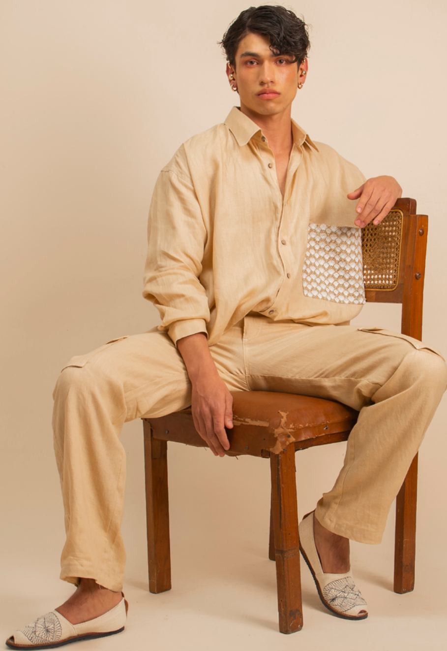
CAMISA / SHIRT BAREQUE- PANTALÓN / PANTS CARGO BAREQUE