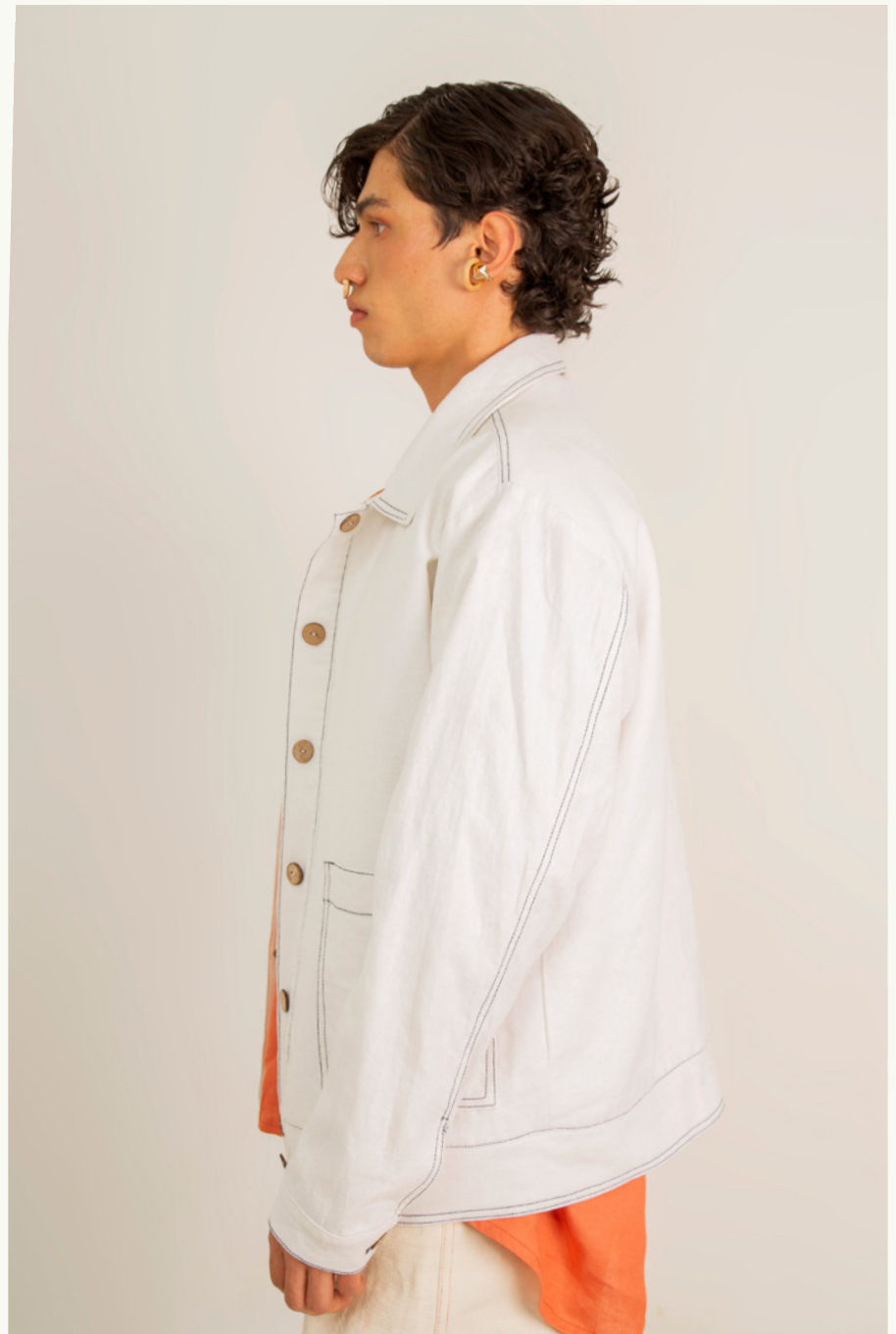
CHAQUETA / JACKET CHICHEME