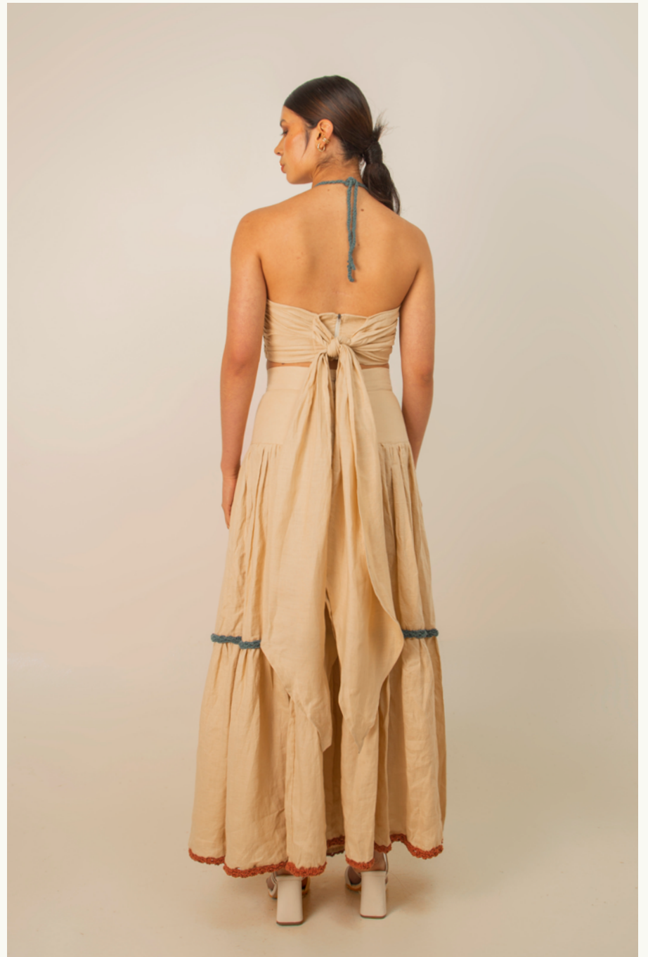
TOP TRES PUNTÁ - FALDA / SKIRT CAMPESINA