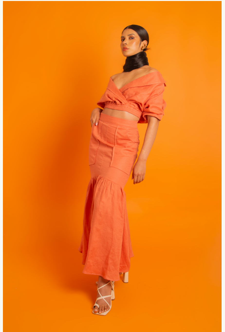
BLUSA / BLOUSE TINAJA - FALDA / SKIRT TINAJA