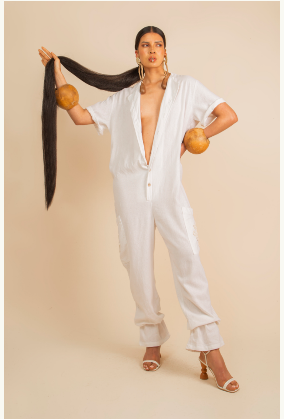
ENTERIZO / JUMPSUIT GRAN CACIQUE