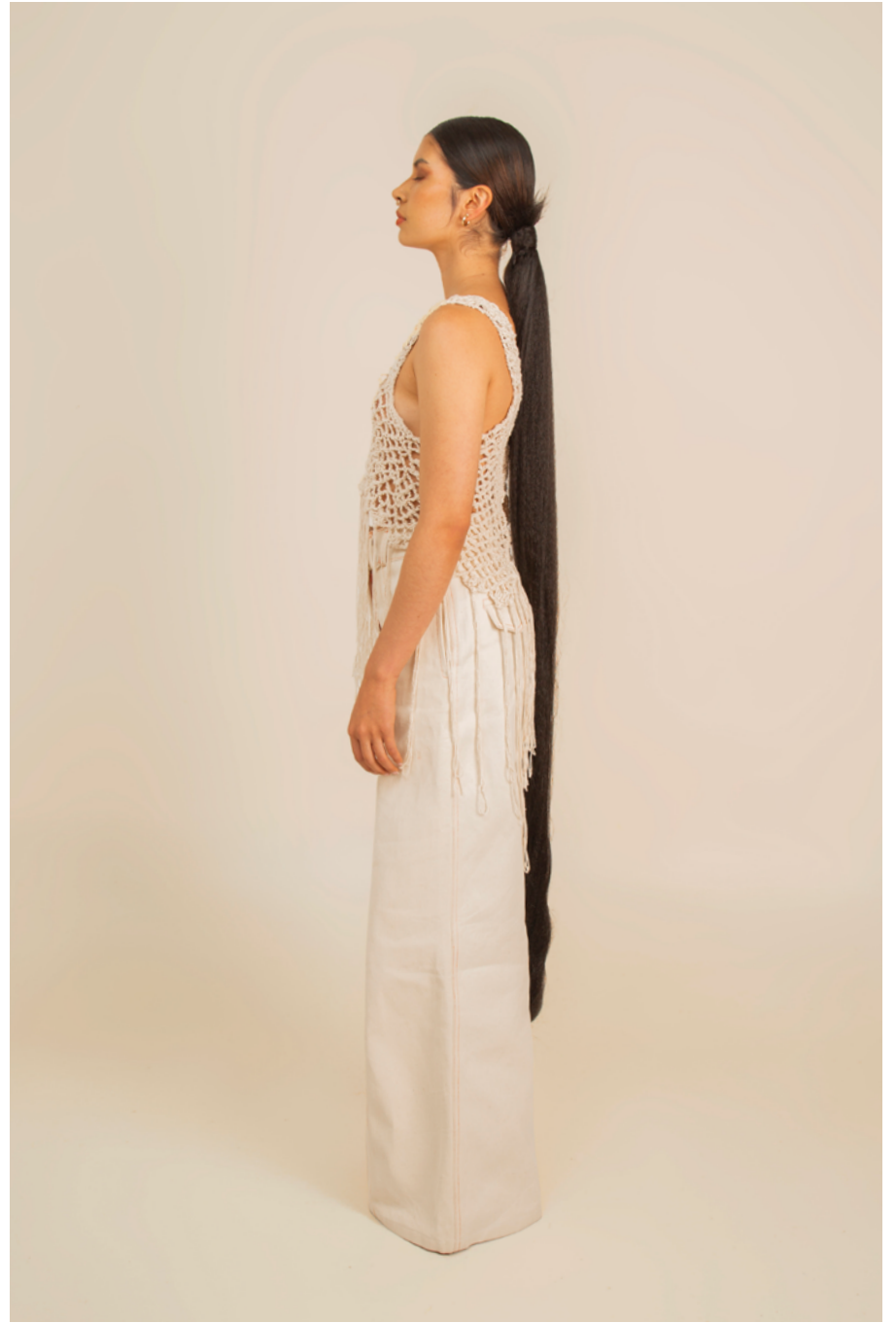
PANTALÓN / PANTS GUAJIBA - TOP PILONERAS ECO