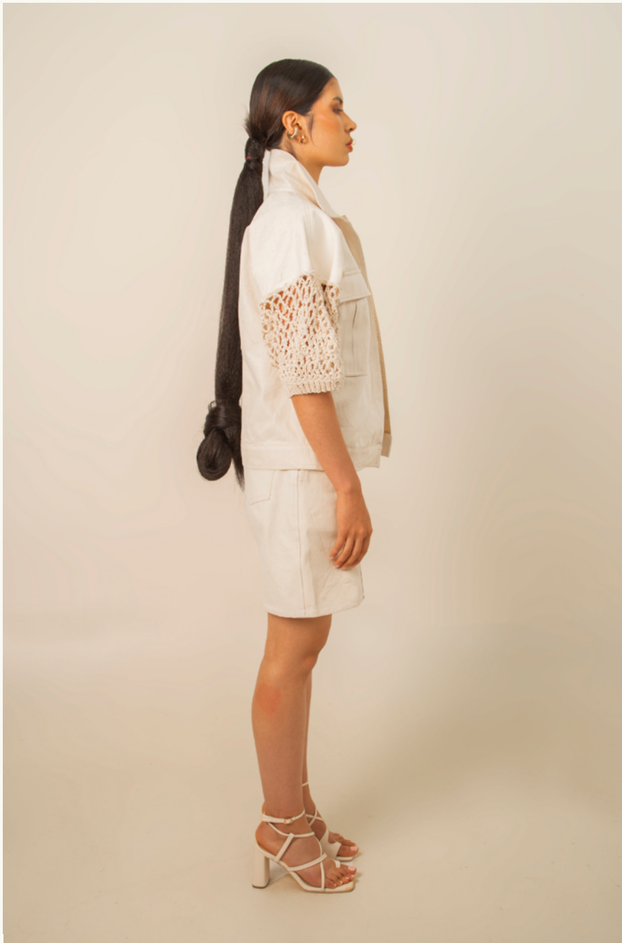
CAZADORA / JACKET BALAY- BERMUDA / SHORTS BALAY