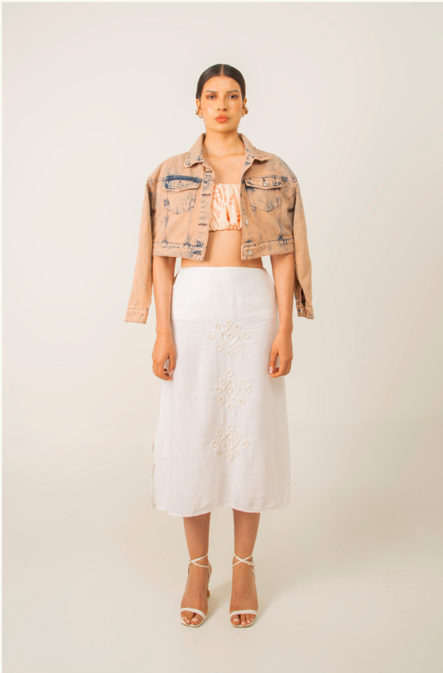
CHAQUETA CROP / CROP JACKET CENAGOSA TOP GRAN ZENÚ ECO - FALDA / SKIRT GRAN CACICA