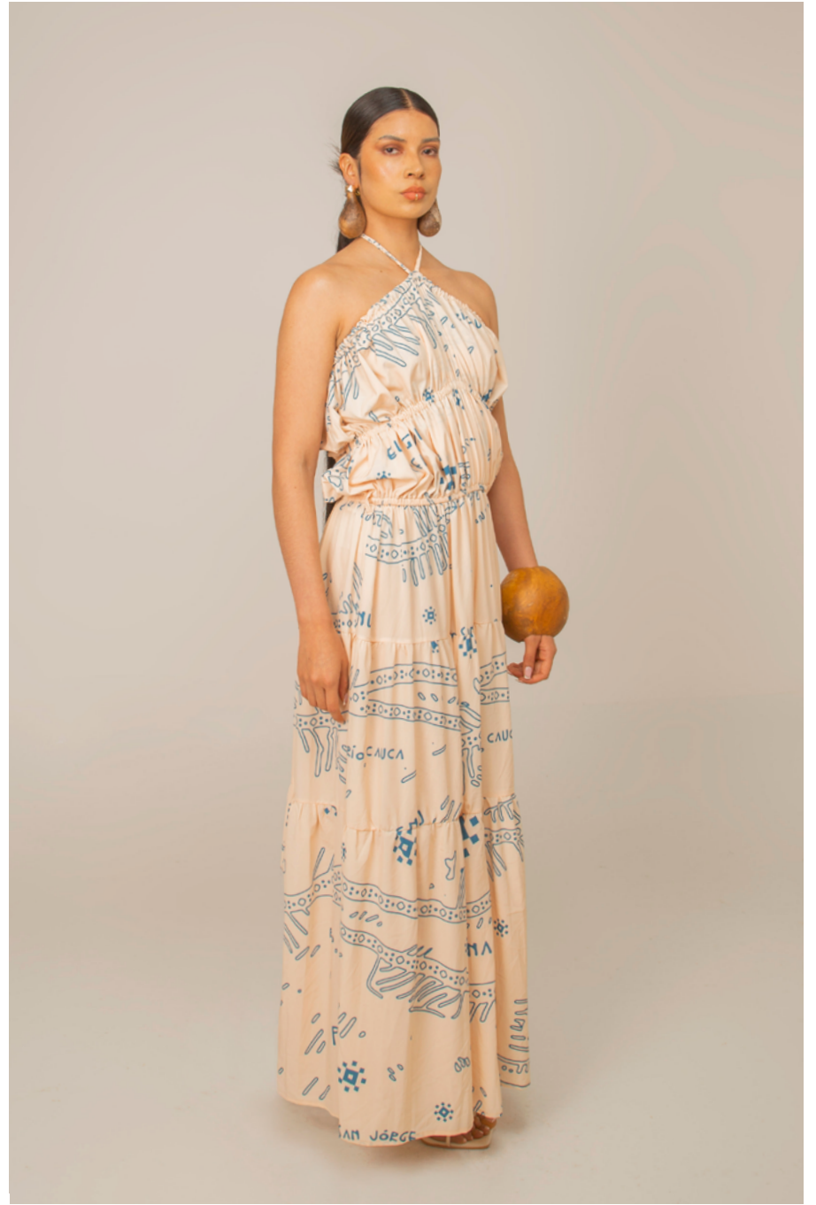
VESTIDO / GOWN GRAN ZENÚ ECO