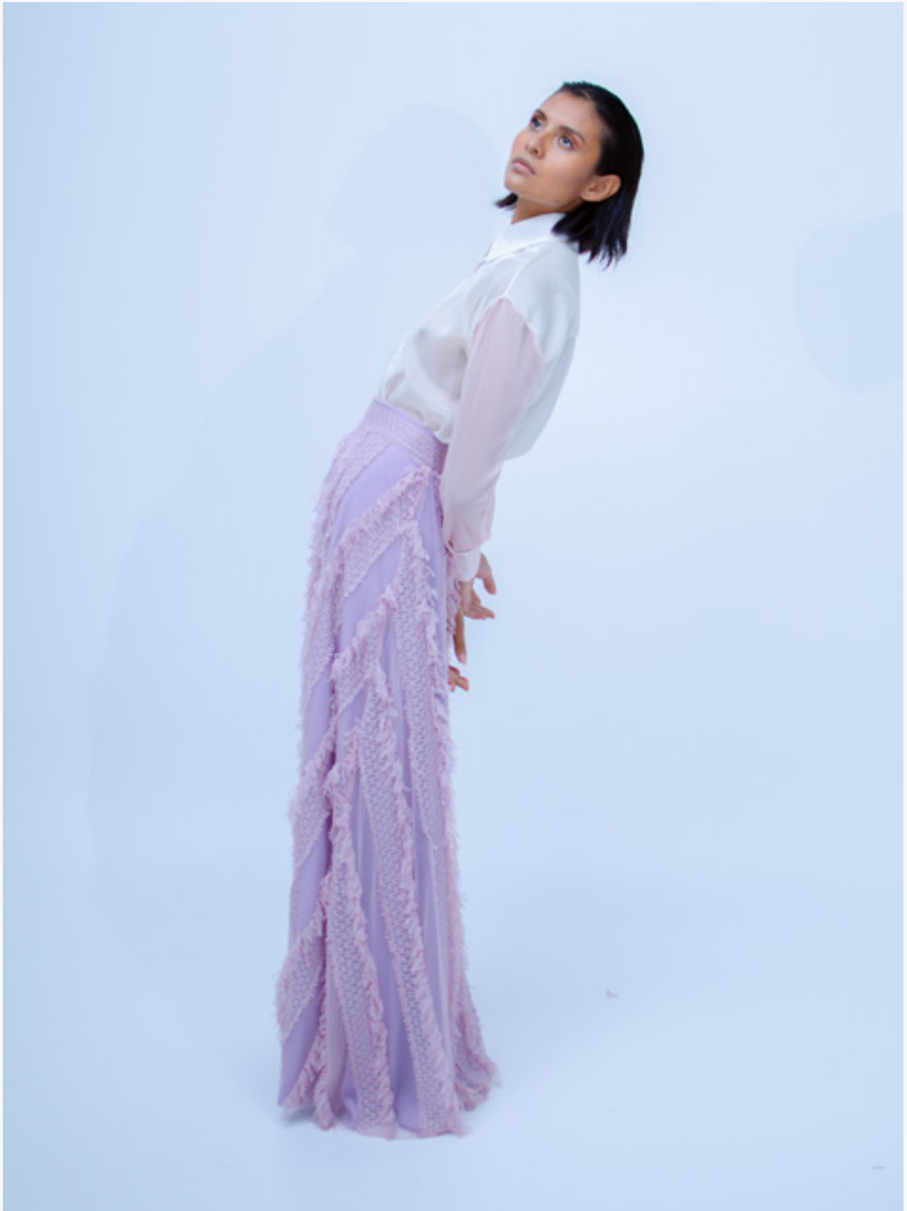
CAMISA / SHIRT ATARDECER - FALDA / SKIRT MUSGO