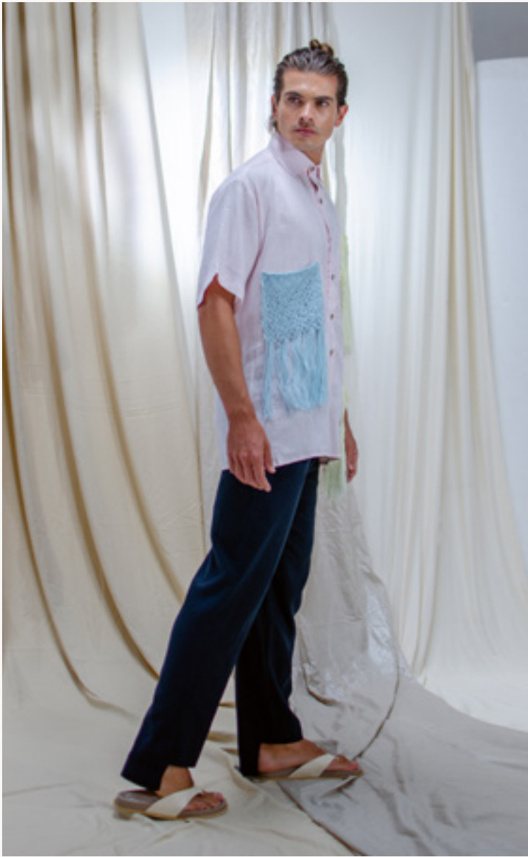
PANTALÓN / PANTS REMO