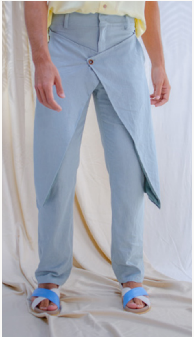
PANTALÓN / PANTS JAIBA