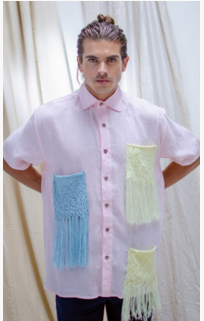
CAMISA / SHIRT COSTERA