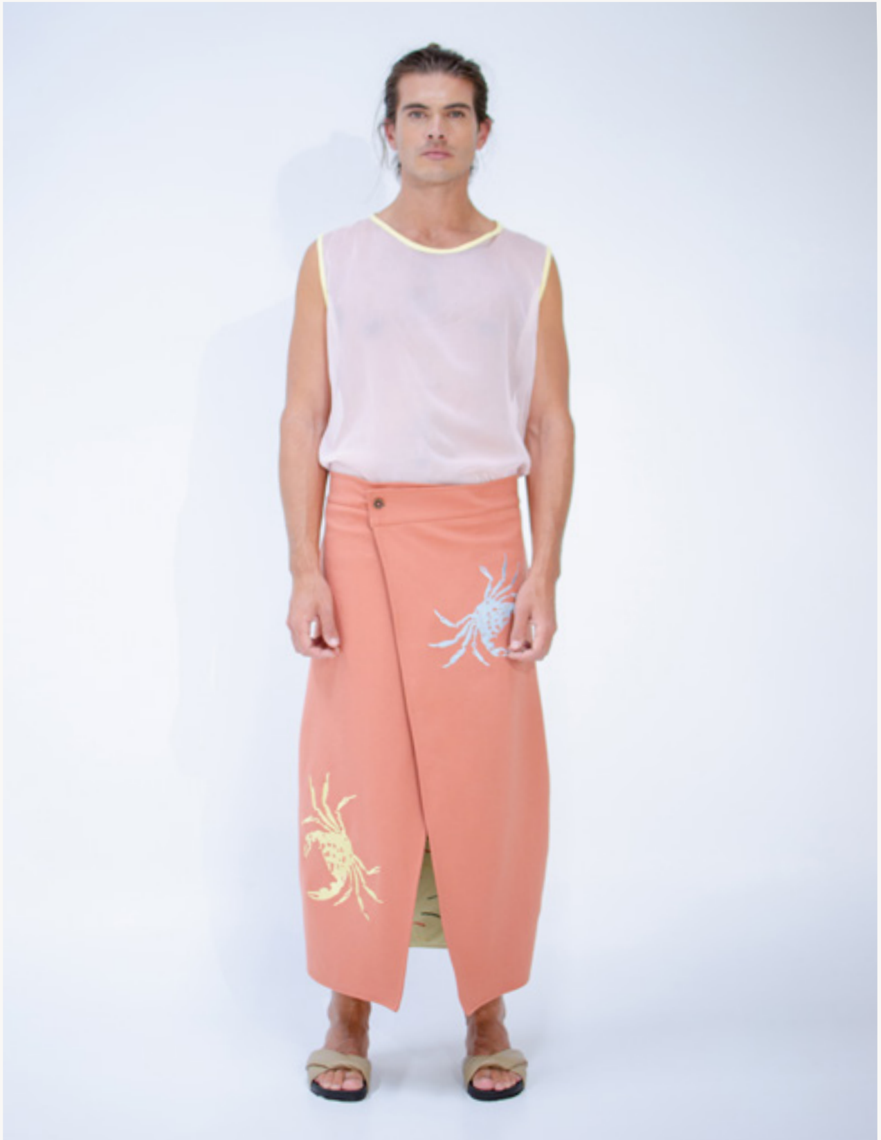
CAMISILLA / SLEEVELESS SHIRT NÁCAR - FALDÓN / SKIRT SALACUNA