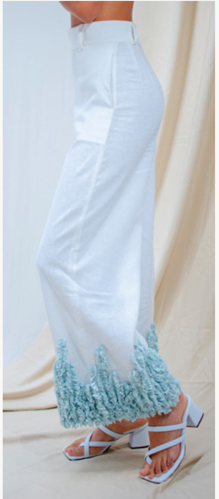
PANTALÓN / PANTS MADREPERLA