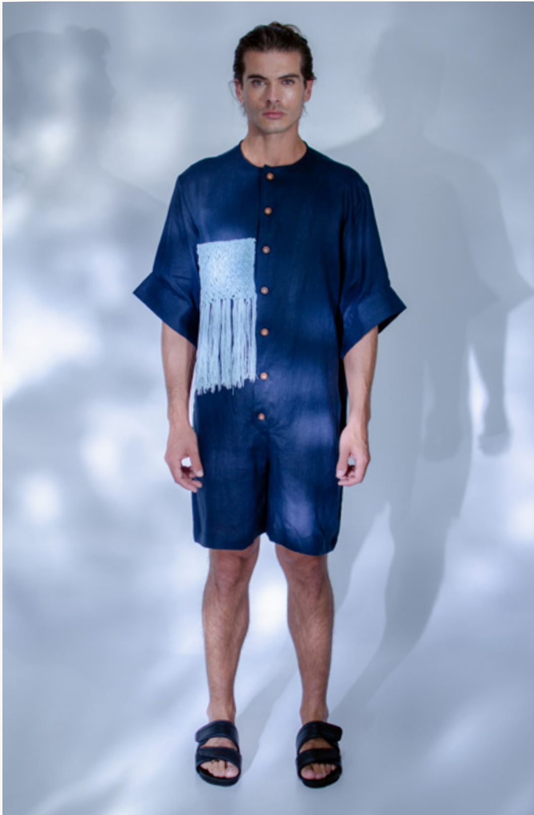
ENTERIZO / JUMPSUIT CIÉNAGA