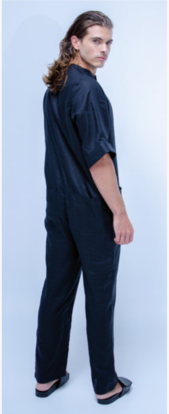
ENTERIZO / JUMPSUIT CIÉNAGA