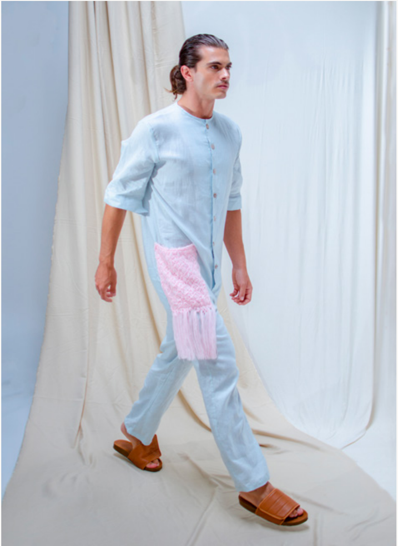
ENTERIZO / JUMPSUIT CIÉNAGA