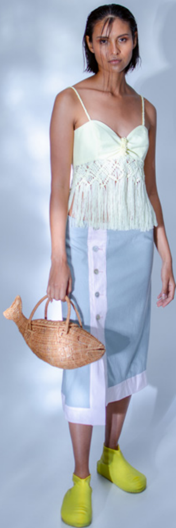
BLUSA / BLOUSE FLOR DE MANGLE - FALDA / SKIRT GARCETA