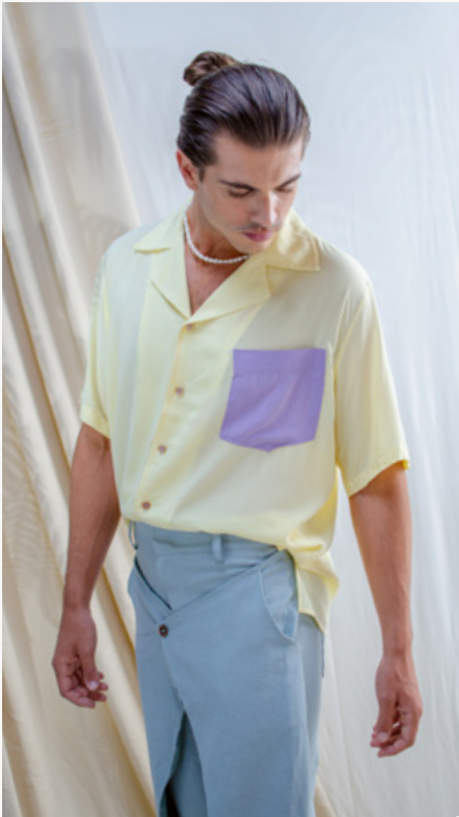
CAMISA / SHIRT AMARO