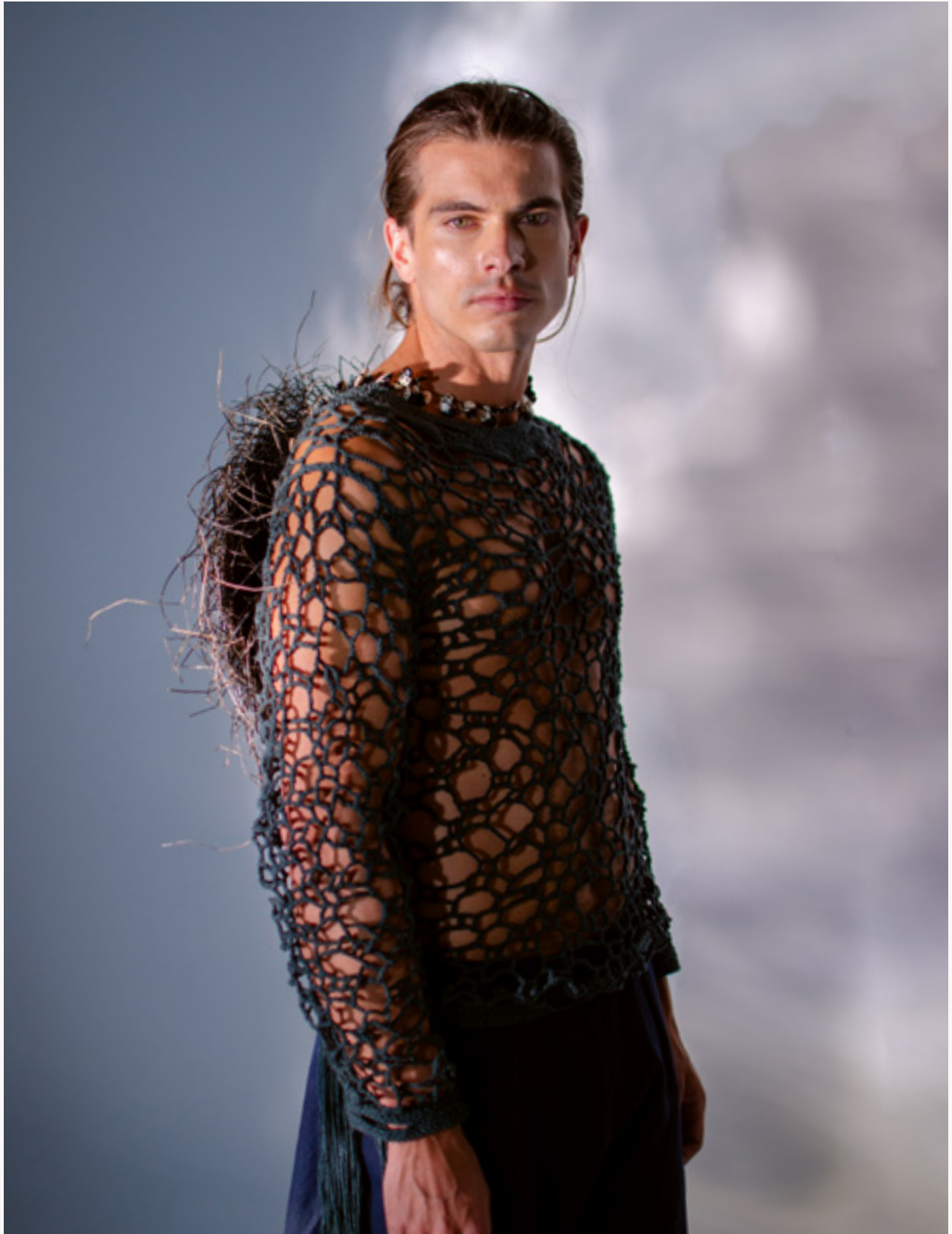
SWEATER PALANGRE - SHORT HELENOR