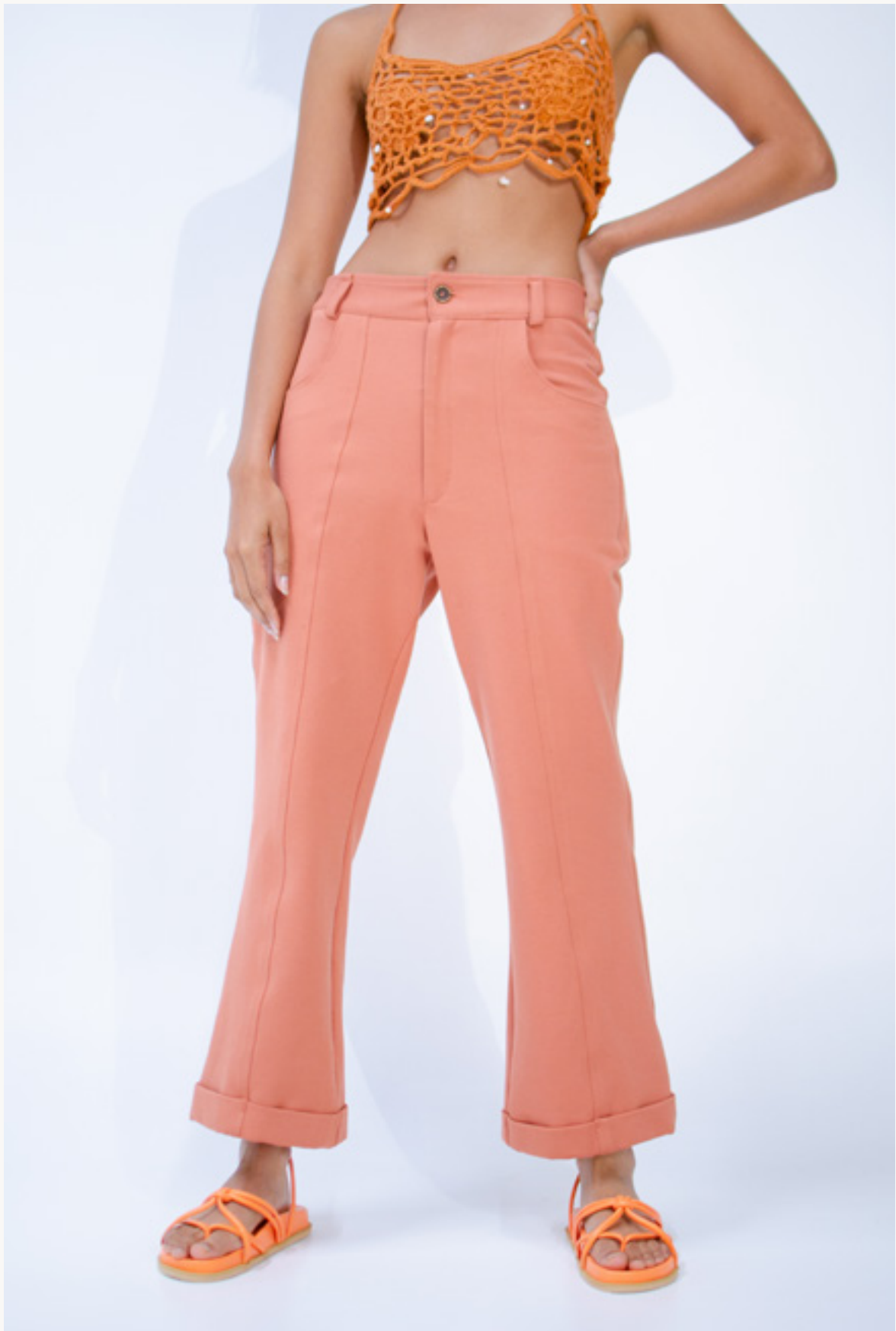
TOP ATARRALLA - PANTALÓN / PANTS CANOA