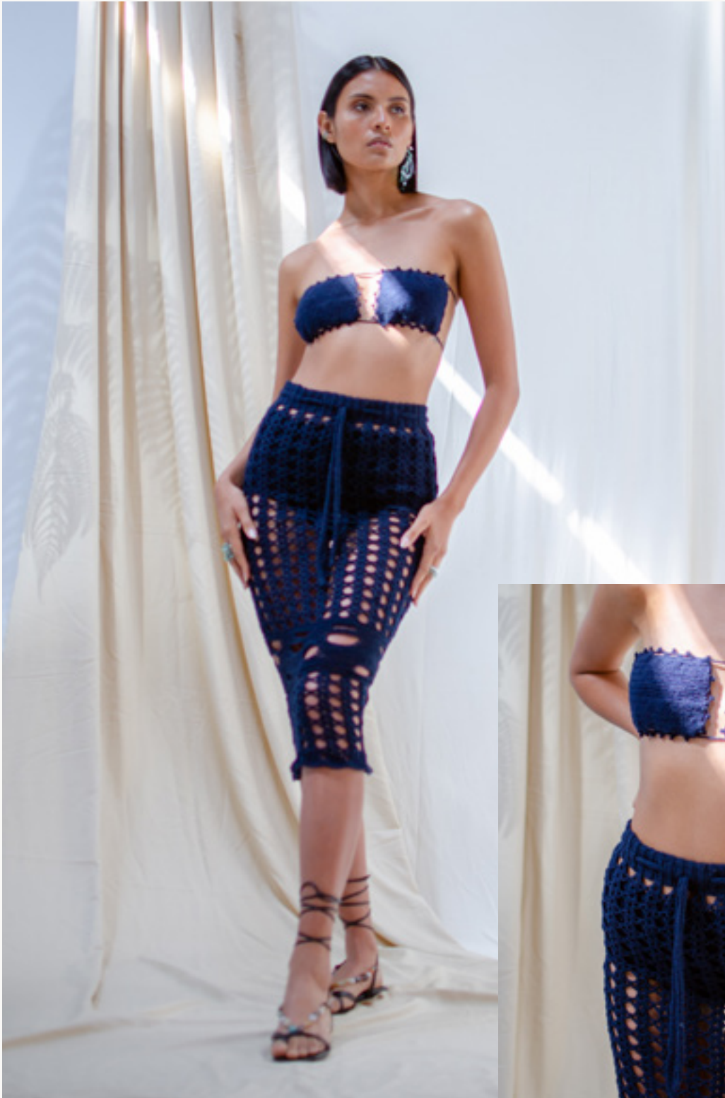
FALDA / SKIRT AGALLERA