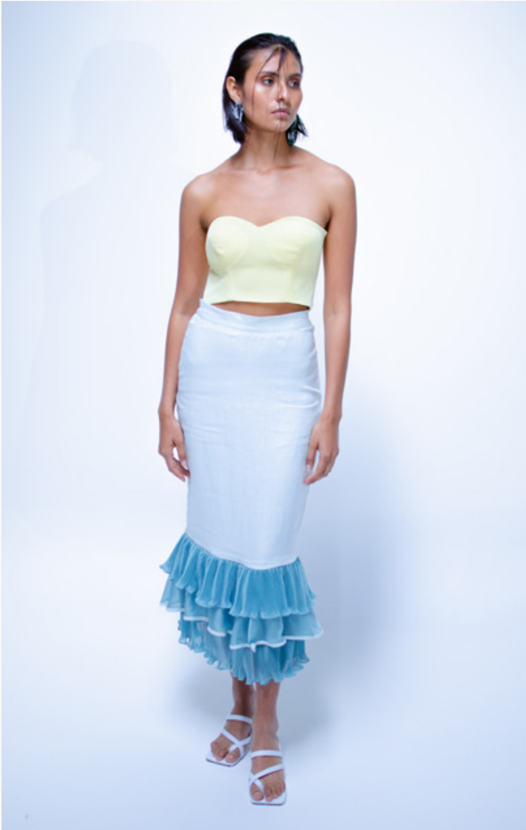
STRAPLESS COVEÑAS - FALDA / SKIRT TOLÚ