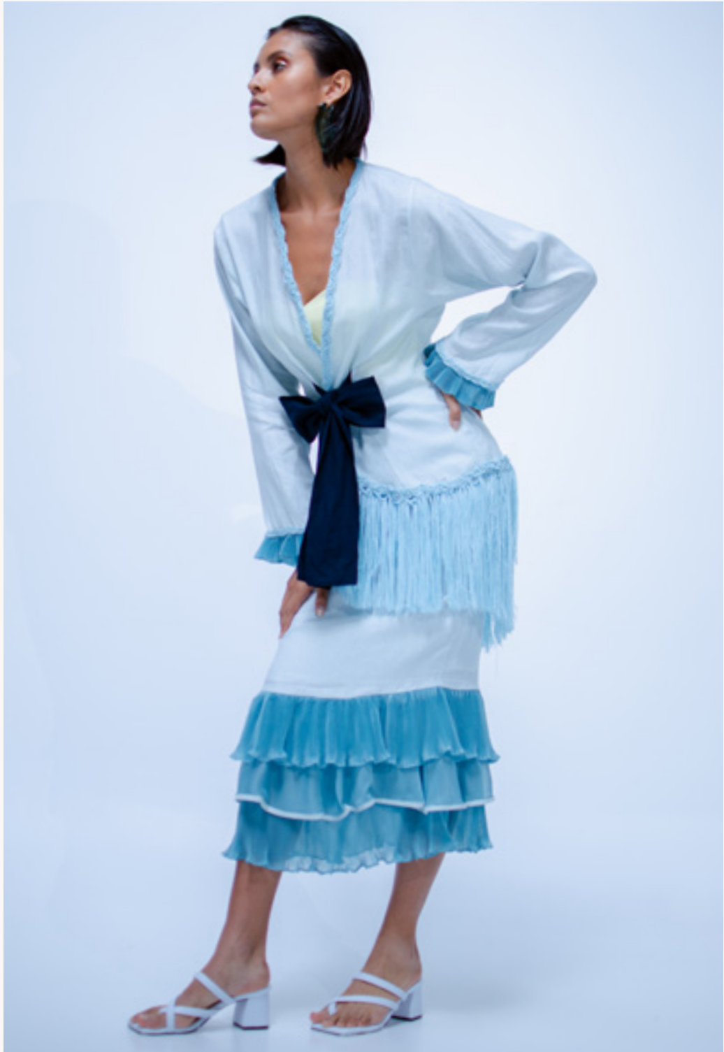
KIMONO TOLÚ - FALDA / SKIRT TOLÚ