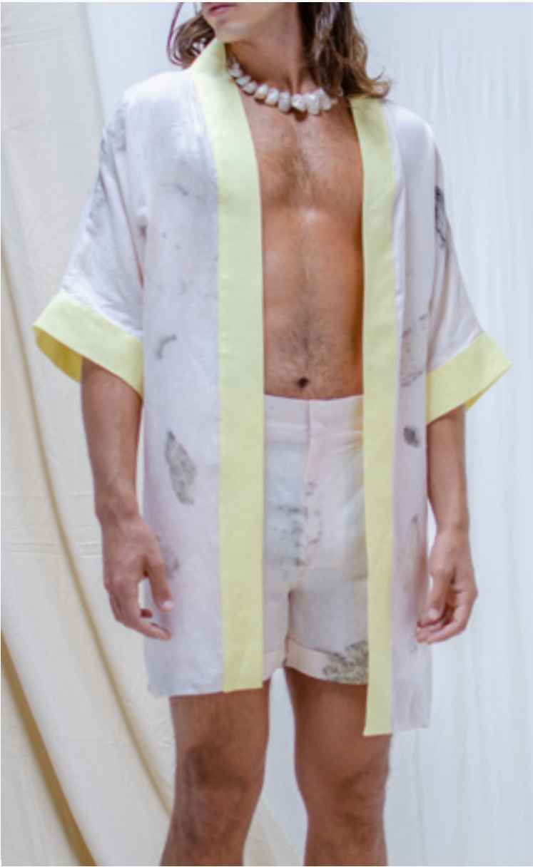
KIMONO ESTUARIO - SHORT ESTUARIO