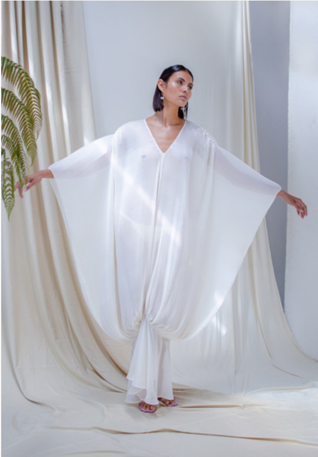
VESTIDO / GOWN PALOMETA